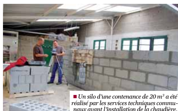
■ Un silo d'une contenance de 20 m 3 a été réalisé par les services techniques communaux avant l'installation de la chaudière.

Auparavant, 10 000 litres de fioul étaient nécessaires chaque année pour assurer le chauffage des serres d'octobre à fin mars, soit un coût d'environ 5 000 €. Le nouvel équipement, acquis par la commune pour un montant de 22 624 € TTC, nécessite 120 m 3 de plaquettes de bois broyé pour le chauffage d'une année. Le coût du broyage pour cette quantité est de 1650 €.