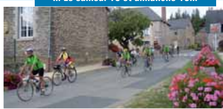
25 e édition de Tout Chartres à vélo. Le club Cyclotourisme chartrain proposait 3 parcours de 30, 65 et 80 km sur Chartres et les communes environnantes. Rendez-vous est pris pour 2011.