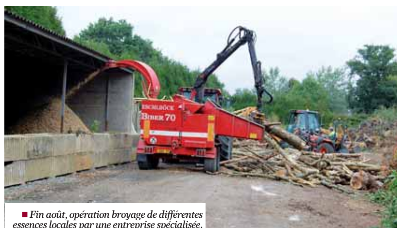
■ Fin août, opération broyage de différentes essences locales par une entreprise spécialisée.