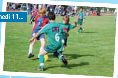
Tournoi de football pour 544 jeunes entre 9 et 13 ans de 28 clubs de l'ouest organisé par l'Espérance de Chartres de Bretagne.