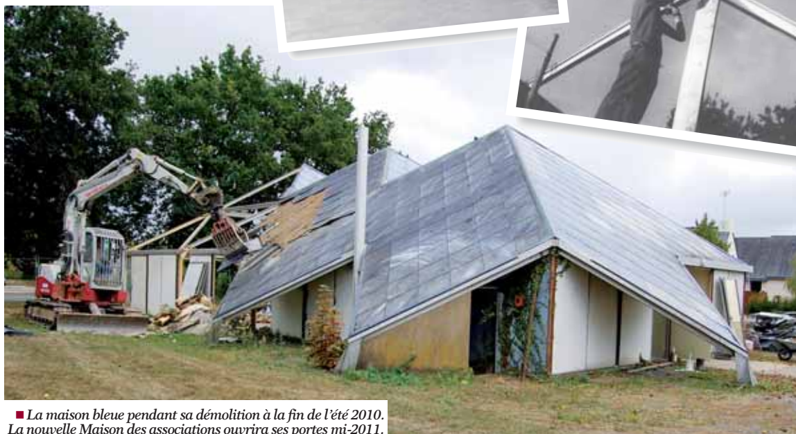
■ La maison bleue pendant sa démolition à la fin de l'été 2010. La nouvelle Maison des associations ouvrira ses portes mi-2011.

A quelques encablures de l'ensemble sportif Rémy Berranger, ce lundi 6 septembre 2010, badauds et curieux observent la pince destructrice qui rugit déjà autour de la maison bleue. Le temps et les normes de sécurité ont eu raison du « Mille-club » érigé il y a exactement 35 ans. Après le désamiantage et la démolition, le site verra s'élever la nouvelle Maison des associations.