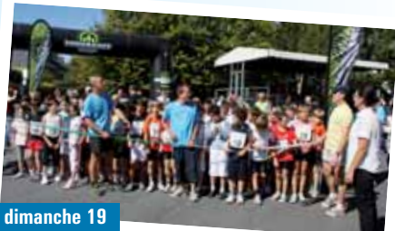
Les conditions climatiques étaient idéales pour la pratique de la course à pied. Les 37 e Foulées Chartraines ont rassemblé près de 500 coureurs de tous âges (voir page 6).