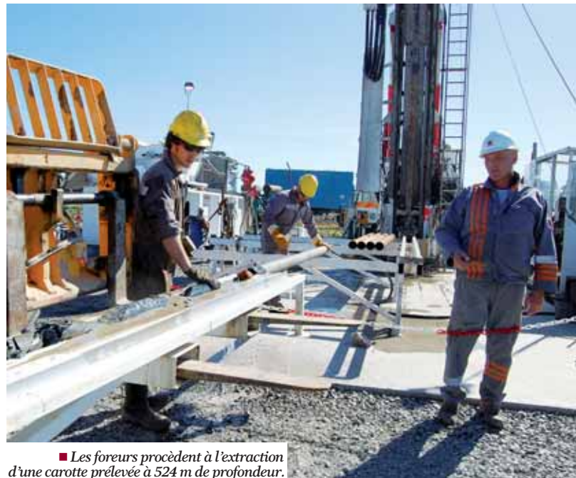
■ Les foreurs procèdent à l'extraction d'une carotte prélevée à 524 m de profondeur.

Sous la surface, la première couche de sédiments, jusqu'à environ 400 m de profondeur, est composée de calcaires, d'argiles, de quelques bancs de sables ; des roches charbonneuses et bitumineuses ont également été observées. Si la plupart de cet ensemble date de l'ère tertiaire (moins de 50 millions d'années), la base de ces dépôts argileux