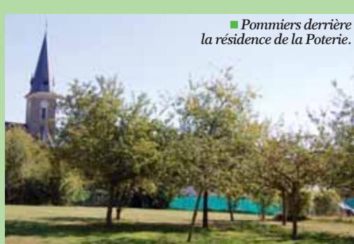
■ Pommiers derrière la résidence de la Poterie.

Depuis quelques années, les jardiniers de la ville de Chartres de Bretagne s'efforcent de planter de nombreux arbres fruitiers tels que pommier à couteau, poirier, prunier, mirabellier, cerisier, châtaignier, néflier. N'hésitez pas à vous servir et profiter de la cueillette et peut-être ensuite des confitures !