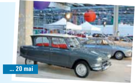
... 20 mai