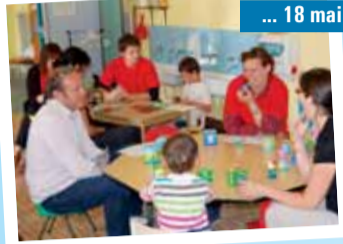
... 18 mai