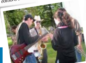
Clichés souvenirs des 5 premières éditions du Son dans les buissons.

Samedi 18 juin Entrée gratuite à partir de 17h45. Buvette bio sans alcool Restauration sur place. Contact : Yann BERRANGER Centre d'animation l'Igloo Tél. 02 99 41 37 62 ou igloo.chartres@wanadoo.fr