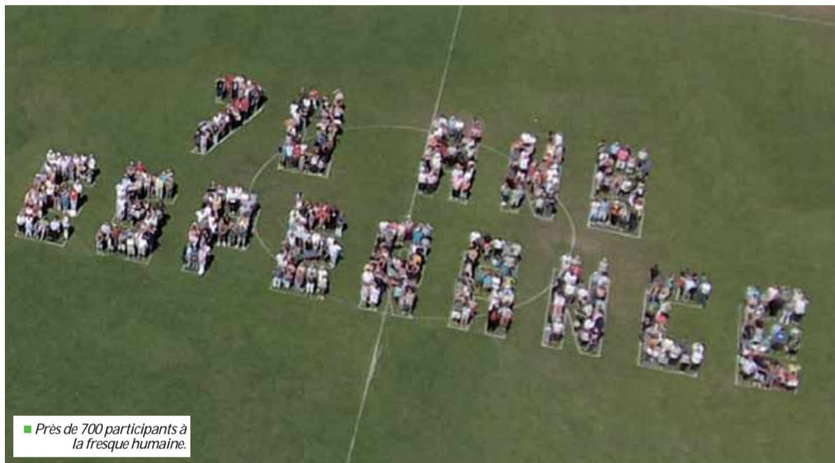
■ Près de 700 participants à la fresque humaine.