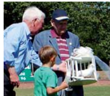
■ 2 colombes ont précédé les 261 pigeons voyageurs dans le ciel chartrain.