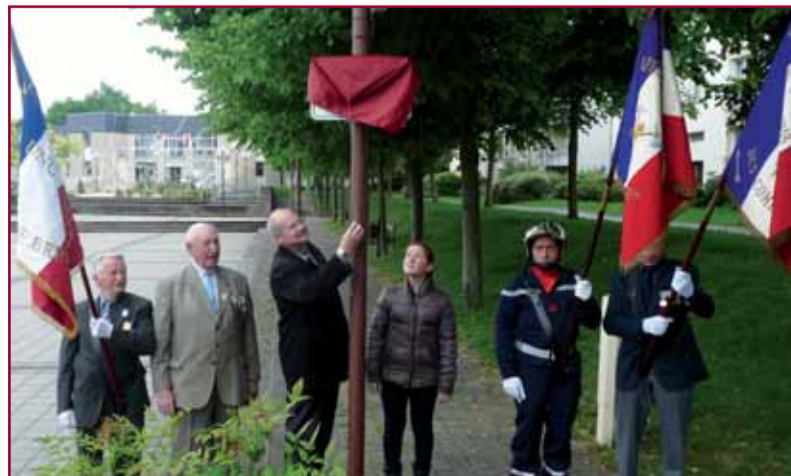
■ La plaque de la Place de la Liberté dévoilée le 8 mai dernier.

La cérémonie a été suivie par l'inauguration de trois places dans le centre-ville. La place située entre l'église et le Centre Jean-Jaurès devient la Place de l'Armistice du 11 novembre 1918. Puis ont été dévoilées entre la rue de la Poterie et l'Esplanade des Droits de l'Homme, les plaques des Place du 8 mai 1945 et Place de la Liberté.