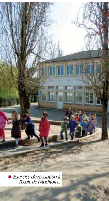
■ Exercice d'évacuation à l'école de l'Auditoire.

Des milliers de Chartrains fréquentent plus ou moins régulièrement des bâtiments publics communaux tels que l'ensemble sportif, les écoles ou encore la mairie. Pour éviter que le moindre incident ne se transforme en tragédie, ces bâtiments font l'objet de contrôles réguliers via des commissions de sécurité.