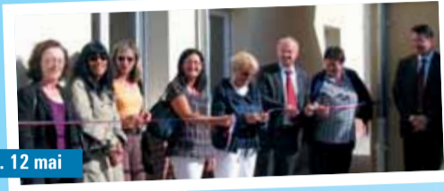
... 12 mai