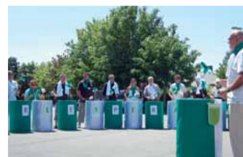
■ Le concert des présidents