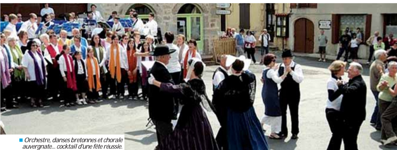
■ Orchestre, danses bretonnes et chorale auvergnate... cocktail d'une fête réussie.