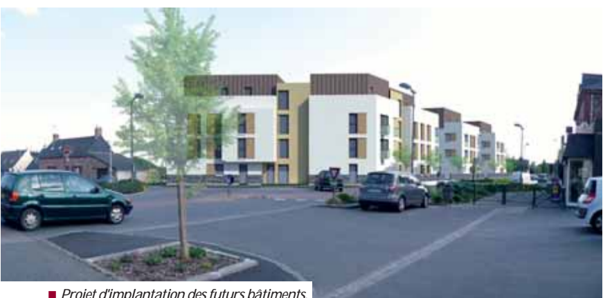
■ Projet d'implantation des futurs bâtiments.

Sur les 38 logements construits, 50% seront aidés dont 18 seront réalisés par Archipel Habitat et destinés au parc locatif social. Les autres logements seront ouverts à l'accession libre. En ce qui concerne la typologie des logements, les trois bâtiments abriteront 10 T2, 16 T3 et 12 T4. Pour compléter, 57 stationnements (25 en aérien et 32 en sous-sol) plus quelques places le long de l'Avenue du Général de Gaulle seront aménagés. Les travaux devraient commencer au printemps 2012 pour une livraison fin 2013-début 2014.