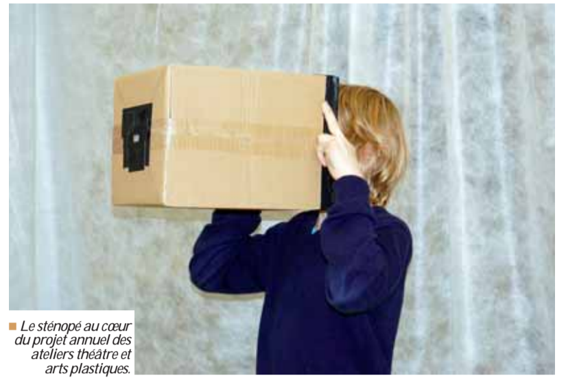
Le sténopé au cœur du projet annuel des ateliers théâtre et arts plastiques.

Quelques-uns des sténopés réalisés, dans leur version négative ou positive, seront présentés : « Au-delà de ce procédé, les jeunes ont également travaillé sur la notion de recadrage et sur les histoires évoquées par les images.